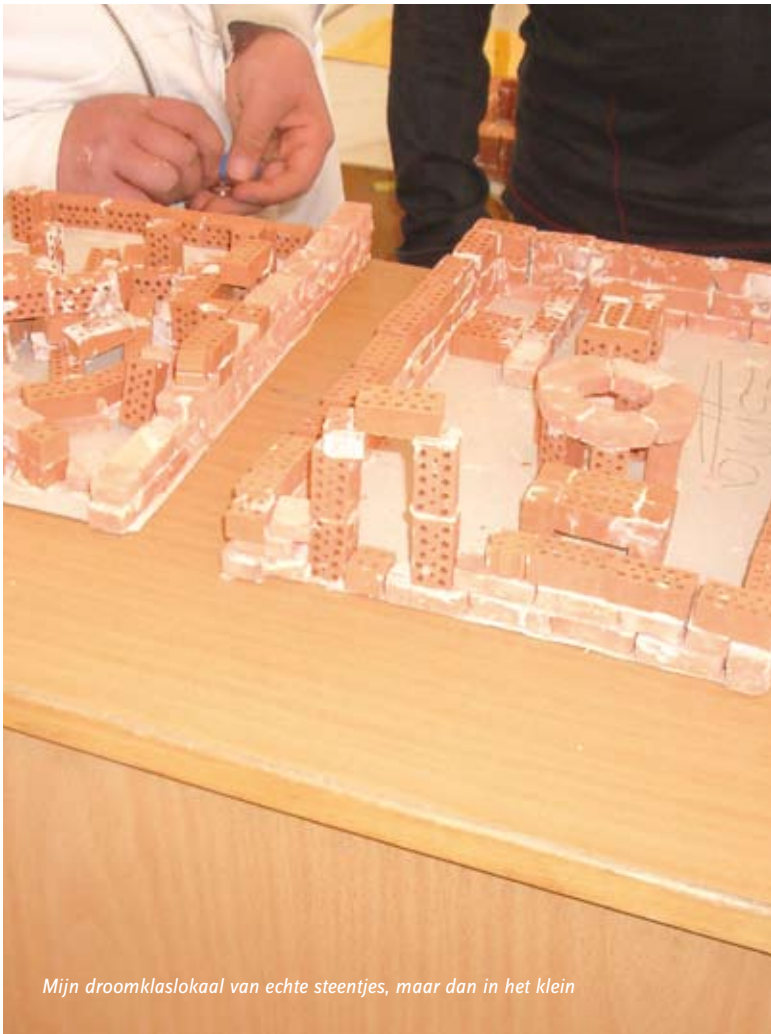
Mijn droomklaslokaal van echte steentjes, maar dan in het klein