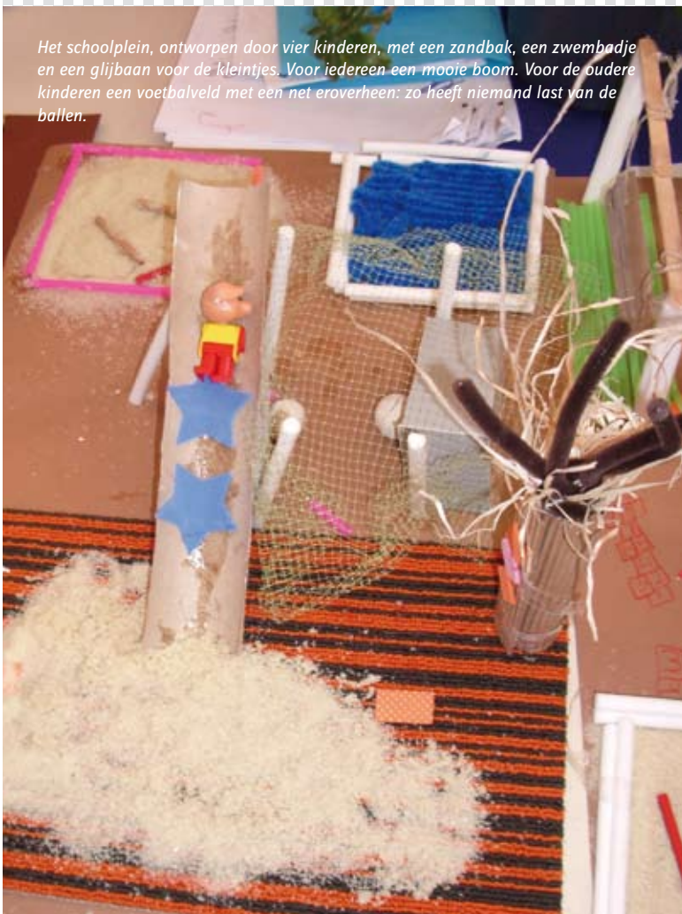
Het schoolplein, ontworpen door vier kinderen, met een zandbak, een zwembadje en een glijbaan voor de kleintjes. Voor iedereen een mooie boom. Voor de oudere kinderen een voetbalveld met een net eroverheen: zo heeft niemand last van de ballen.