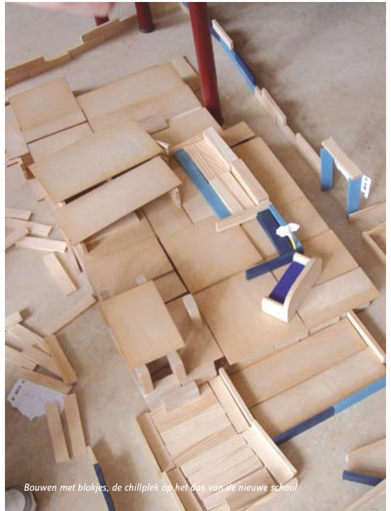
Bouwen met blokjes, de chillplek op het dak van de nieuwe school