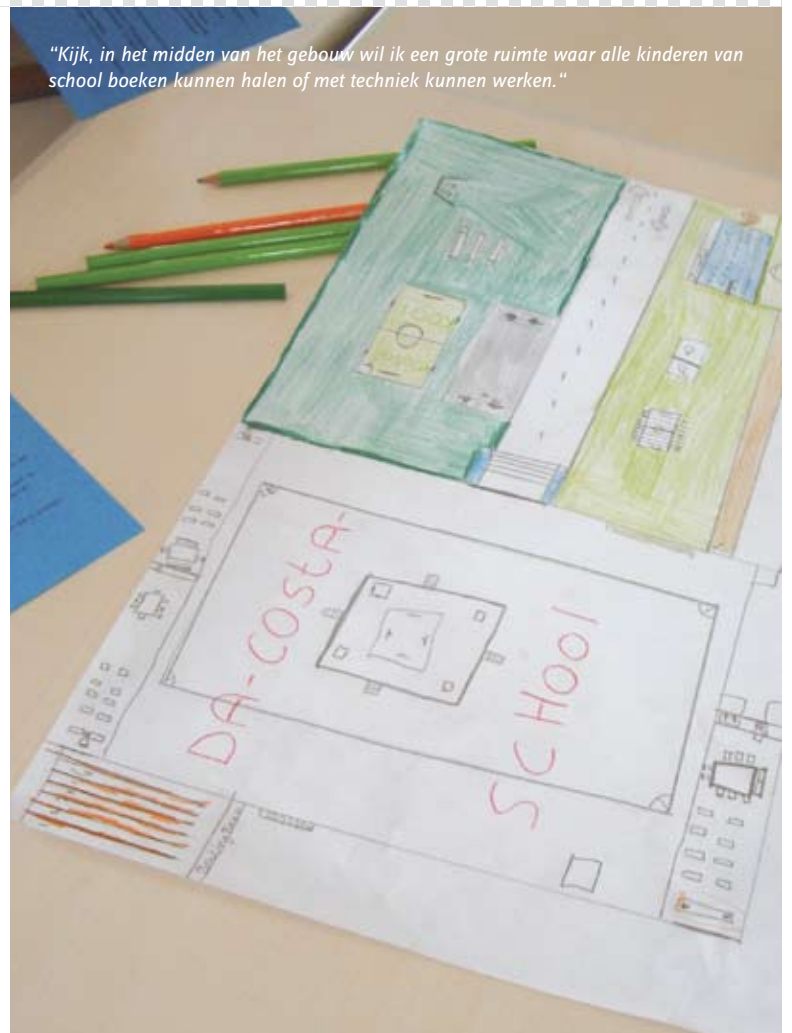
"Kijk, in het midden van het gebouw wil ik een grote ruimte waar alle kinderen van school boeken kunnen halen of met techniek kunnen werken."