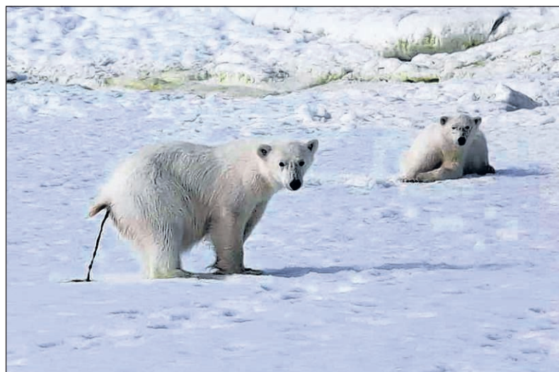
'De mens verstoort het natuurlijk evenwicht, op allerlei gebieden en niveaus'.

volg is van ons toedoen of veronachtzaming. Het is niet aan de orde of ik een diersoort zal missen! Die 'ik' doet er nauwelijks toe. Het